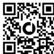
Berceau Saint Bernard

Un reçu fiscal sera envoyé à chaque donateur !